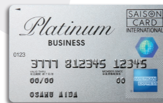
セゾンプラチナ・ビジネス アメリカン・エクスプレス・カード